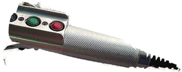
MANDO ESPECIAL EÓLICA